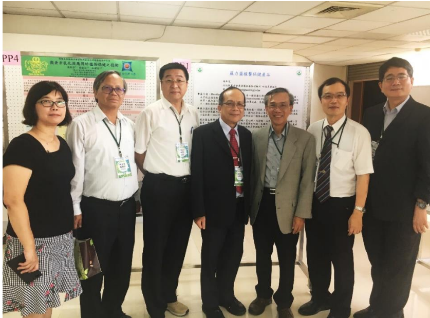
圖 15、研討會重要演講者合影