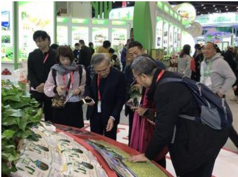
圖 12、鄭州綠色食品博覽會陳列產品