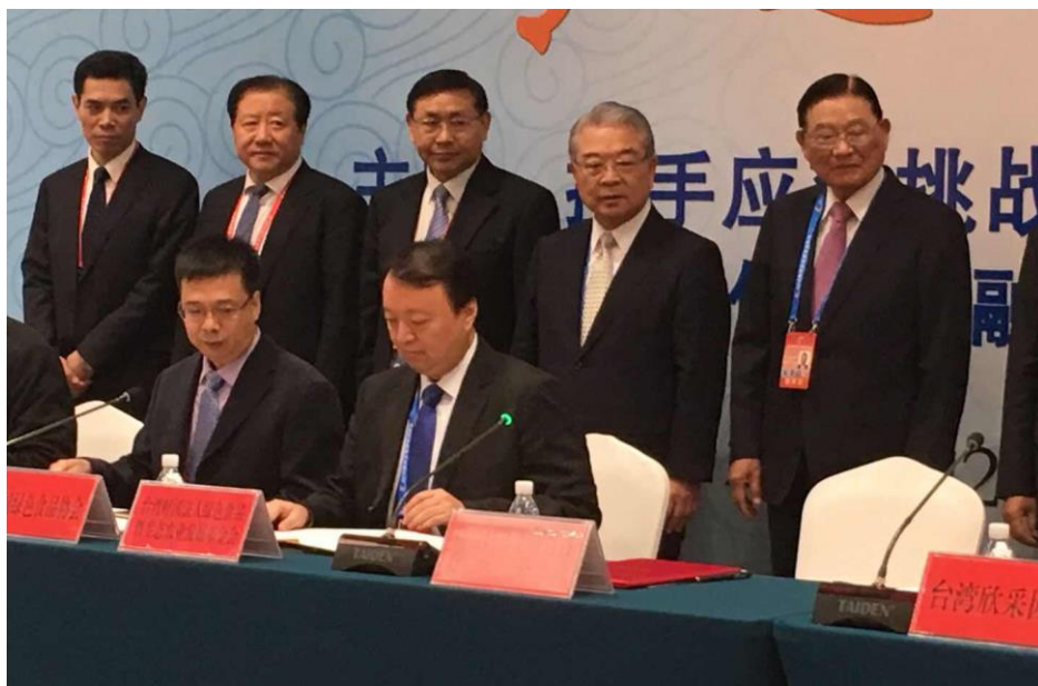
圖 1、基金會與大陸綠色食品協會簽署交流與合作備忘錄