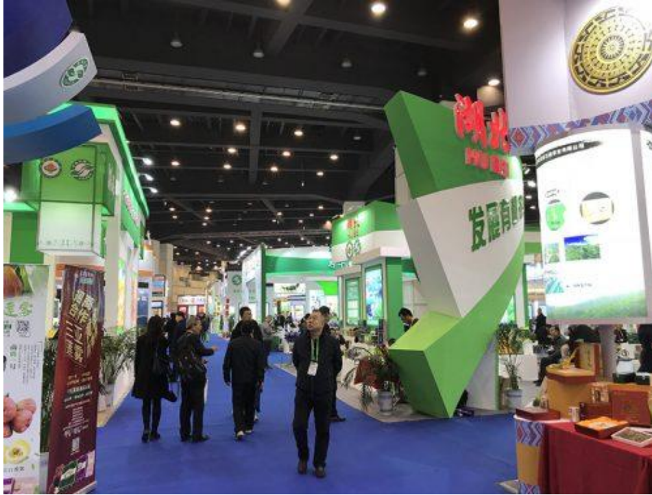
圖 11、鄭州綠色食品博覽會展場

色食品博覽會(以下簡稱綠博會)。基金會為實際了解大陸對綠色食品的推廣、管理與運作方式，乃邀請國內企業、相關公協會組成 8 人參訪團前往鄭州參觀綠博會，併進行考察與觀摩(圖 11~圖 13)。