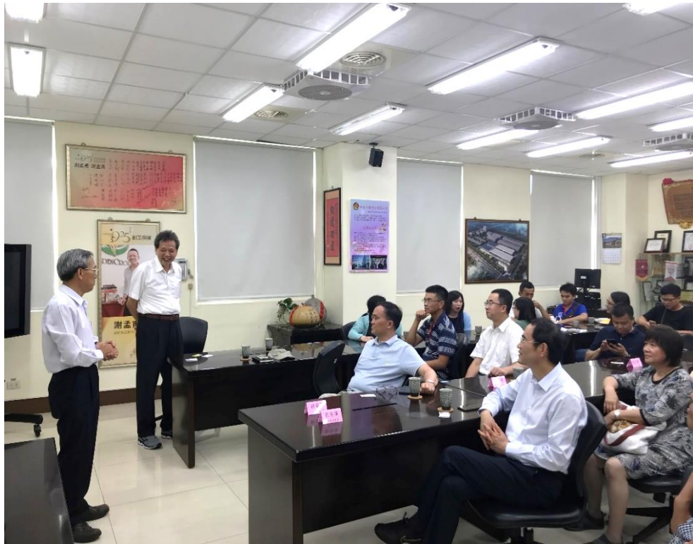
圖 6、參訪鈺統食品公司