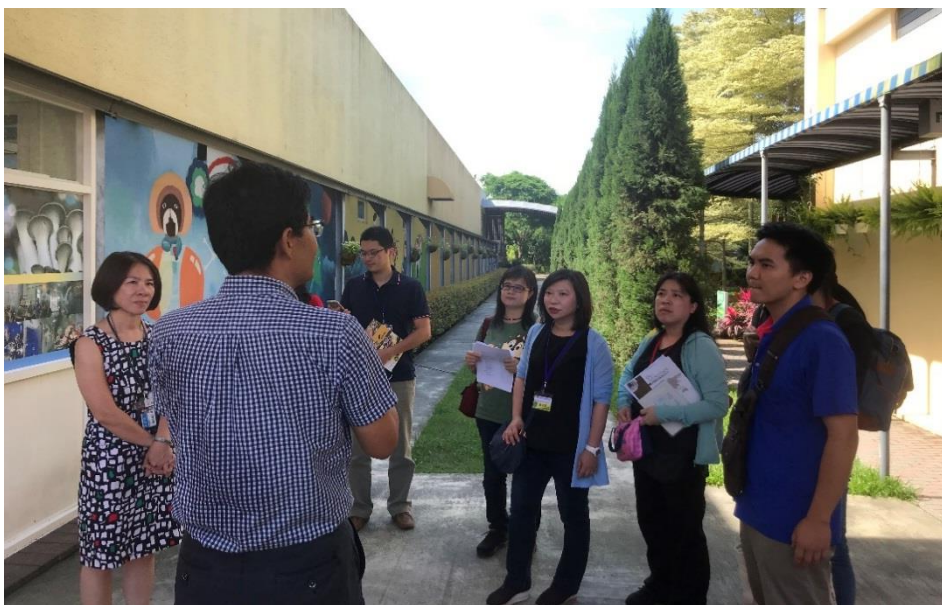
圖 5、參訪葦優科技公司