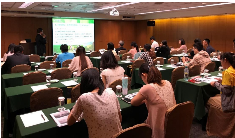
圖 10、兩岸認、驗證與檢驗業務交流