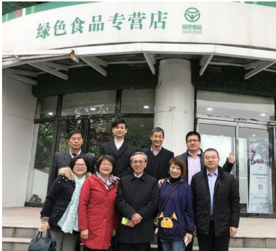
圖 13、鄭州綠色食品專營店

大陸本屆綠博會以「綠色生產、綠色消費、綠色發展」為主題，由獲得綠色食品標誌、有機食品標誌與農產品地理標誌的產品參展，同時將綠色生產資材納入參展項目。本屆參加綠博會的企業近 2000 家。大會為協助綠色食品市場流通和市場銷售對接，邀請著名批發市場、連鎖超市、電商等到展場現場洽談採購，以促進有品牌、有認證的優質、安全農產品、食品的加速拓展。