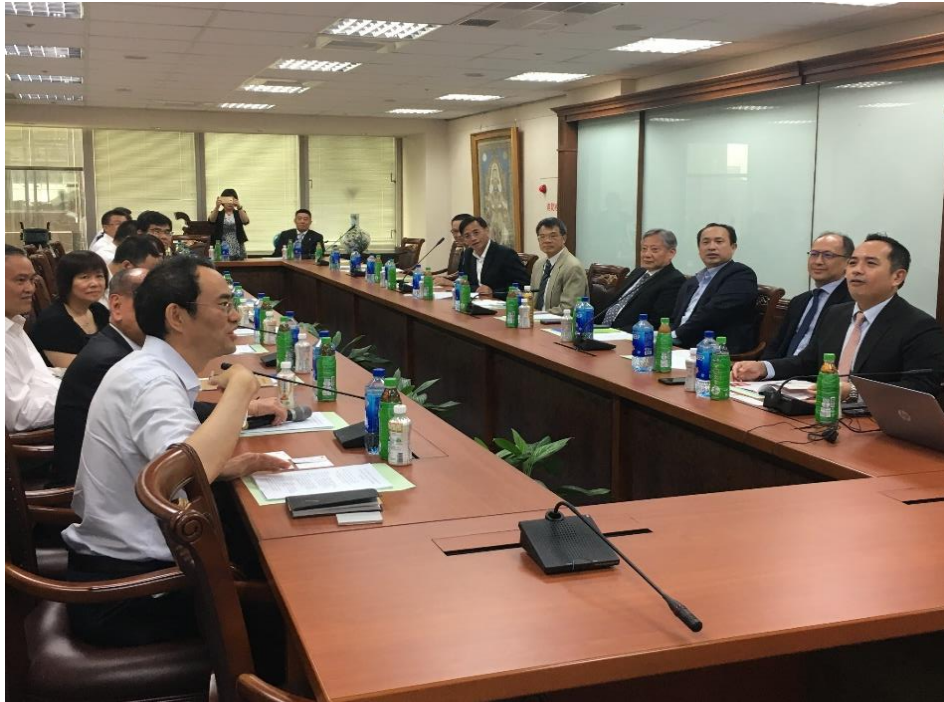
圖 4、參訪愛之味股份有限公司

在座談會後安排大陸參訪團進行參訪活動，包含拜會台灣商業聯合總會、愛之味股份有限公司、葦優生技公司、鈺統食品公司、台一生態休閒農場、永齡有機農業園區、家樂福公司高雄鼎山店等。經由參訪單位熱情接帶與解說，讓大陸參訪團對台灣農產品、食品生產、加工、物流等管理業務，留下深刻的印象（如圖 4～圖 8）。