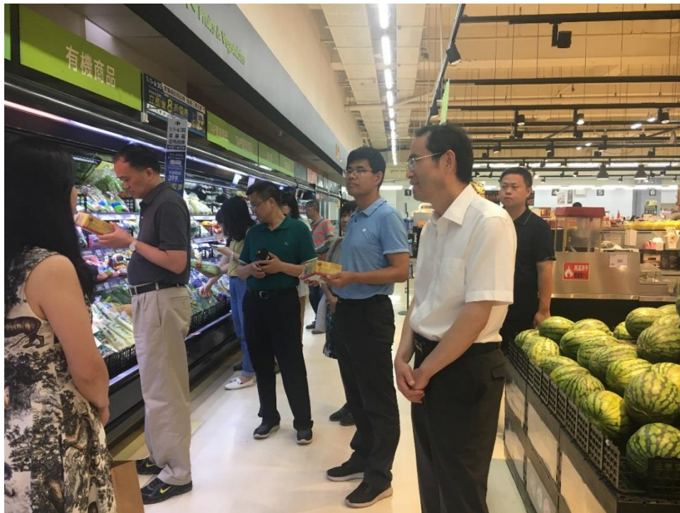
圖 8、參訪家樂福公司鼎山店